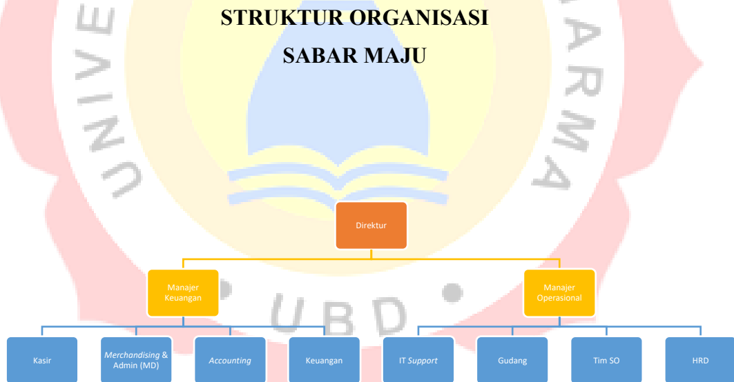
Gambar 1 : Struktur Organisasi CV Sabar Maju

Struktur organisasi adalah gambaran mengenai hubungan kerja antar bagian di dalam sebuah perusahaan. Di dalamnya terdapat pembagian peran, tugas, dan wewenang yang jelas untuk setiap posisi atau jabatan. Setiap bagian memiliki tanggung jawab tertentu yang saling berkaitan, dan semuanya bekerja dalam satu sistem yang terintegrasi. Struktur ini juga memberikan penjelasan rinci mengenai siapa yang bertanggung jawab atas apa, serta bagaimana alur kerja dan koordinasi dilakukan. Dengan adanya struktur organisasi, perusahaan dapat lebih mudah memantau kinerja setiap bagian dan memastikan bahwa semua peran dijalankan sesuai dengan fungsi dan tanggung jawabnya. Biasanya, susunan ini ditampilkan dalam bentuk visual berupa bagan organisasi, yang memudahkan siapa pun untuk memahami posisi dan hubungan antar bagian dalam perusahaan. Berikut ini adalah struktur organisasi yang berlaku di CV Sabar Maju :