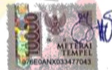
Shuw Thoe Liung