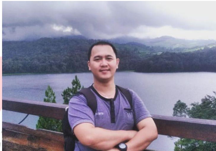
Gambar 6.5 Foto Narasumber 5