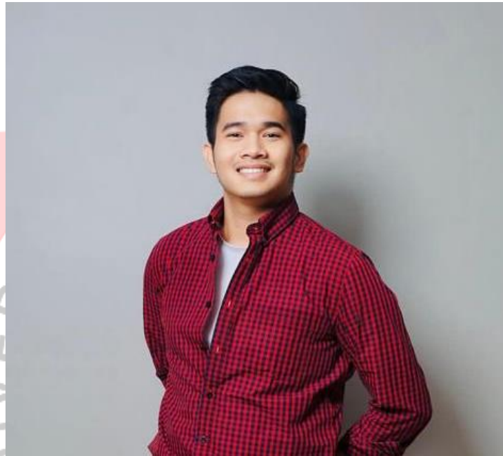
Gambar 6.2 Foto Narasumber 2