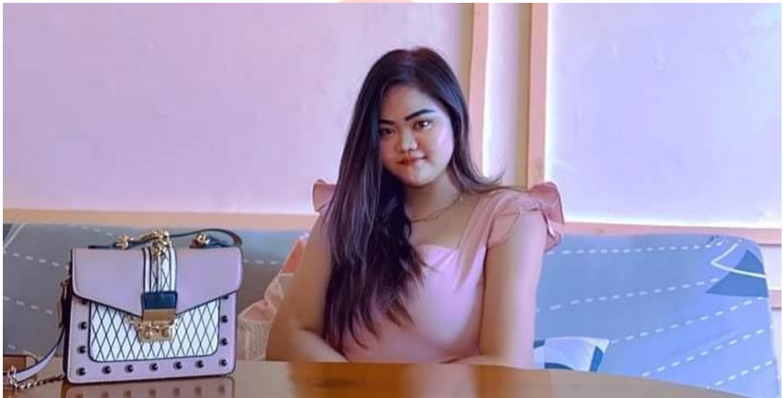
Gambar 6.1 Foto Narasumber 1