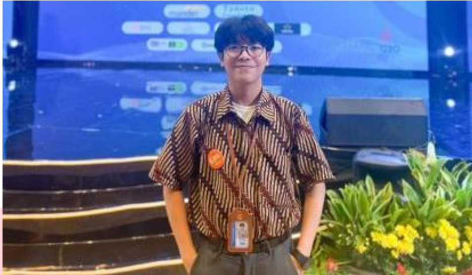
Gambar 6.4 Foto Narasumber 4