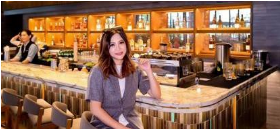
Gambar 6.3 Foto Narasumber 3